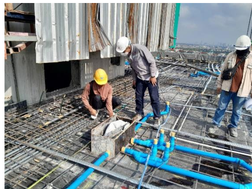
รูปที่ 24 วิศกรโครงการดูแลควบคุมการทำงาน