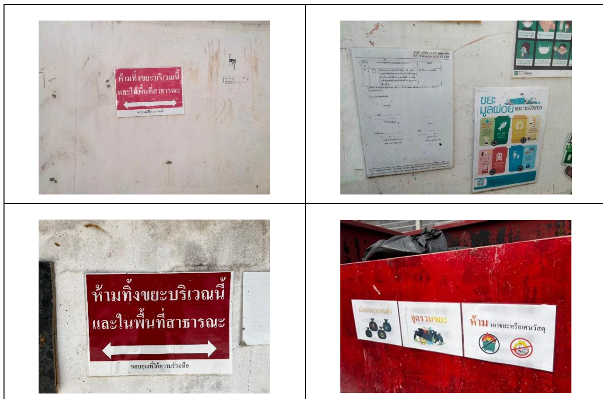
รูปที่ 38 ป้ายรณรงค์ช่วยกันรักษาความสะอาด