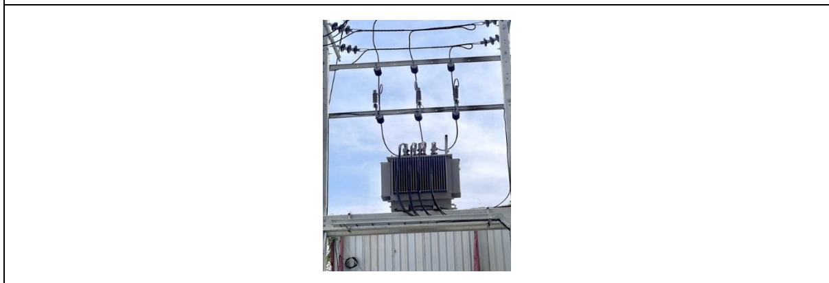
รูปที่ 41 หม้อแปลงไฟฟ้า