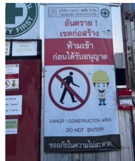
รูปที่ 27 ป้ายแสดงเขตพื้นที่ก่อสร้าง