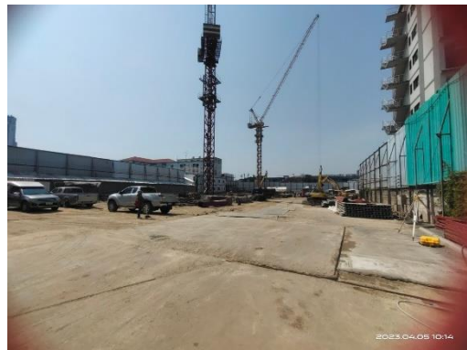
รูปที่ 2 การดำเนินกิจกรรมและการปรับพื้นที่ภายในพื้นที่โครงการ ในระยะเสาะเข็มฐานราก