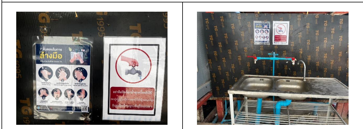
รูปที่ 33 ป้ายรณรงค์ประหยัดน้ำ