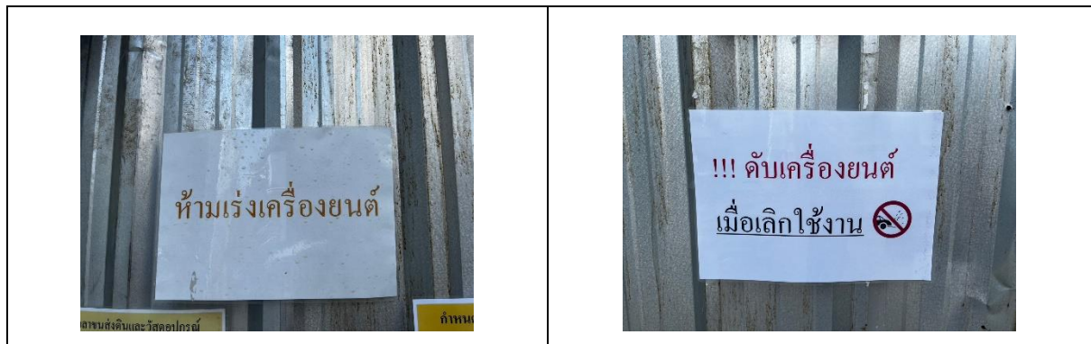
รูปที่ 29 ป้ายห้ามเร่งเครื่องยนต์ และให้ดับเครื่องยนต์เมื่อไม่มีการใช้งาน