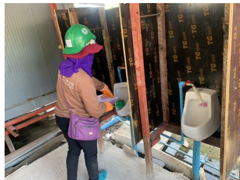
รูปที่ 35 พนักงานดูแลรับผิดชอบทำความสะอาด