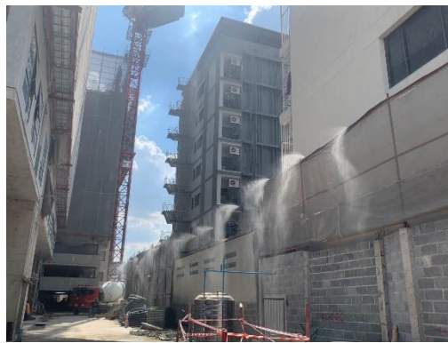
รูปที่ 6 หัวฉีดสเปรย์น้ำ (Spray Nozzles) ติดตั้งที่รั้วชั่วคราว