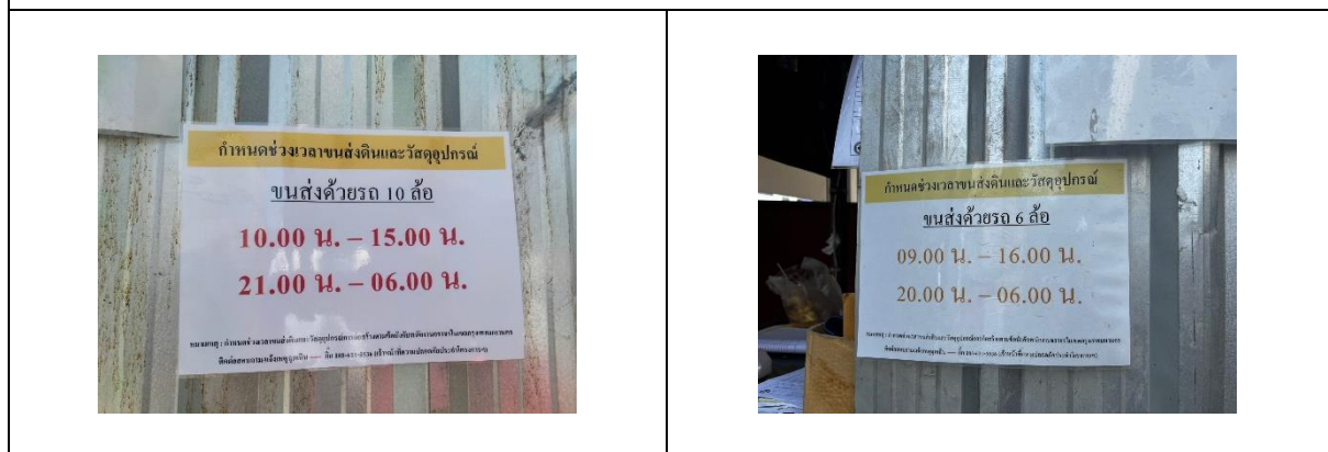
รูปที่ 30 ป้ายกำหนดเวลาขนส่งดินและอุปกรณ์ก่อสร้าง