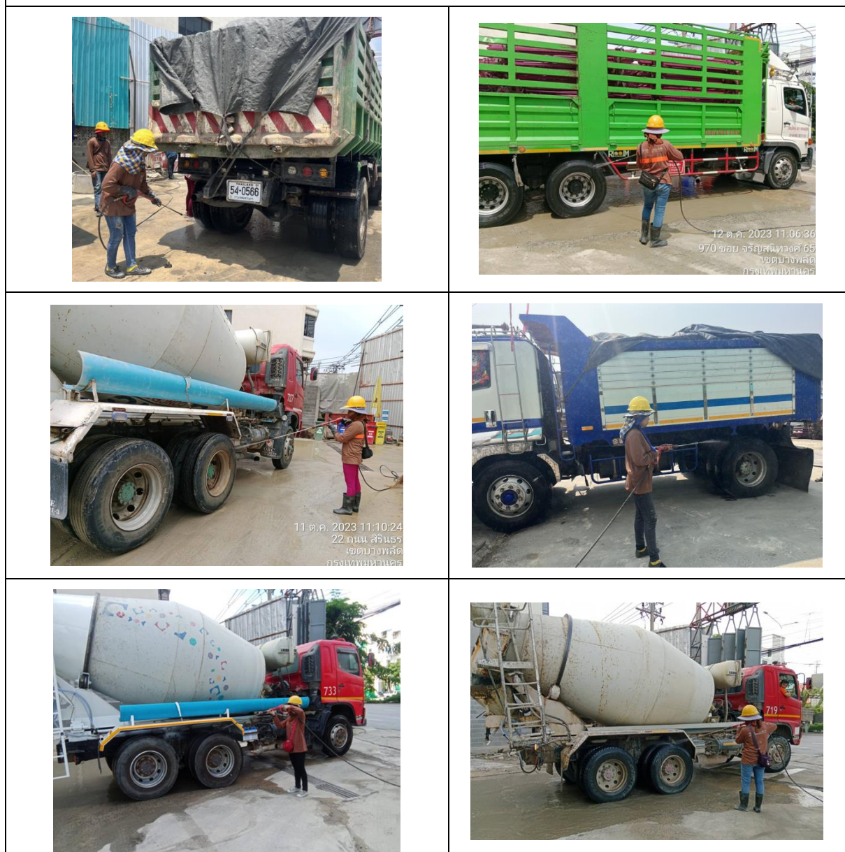
รูปที่ 19 การฉีดล้างล้อรถบรรทุกก่อนออกนอกบริเวณโครงการ