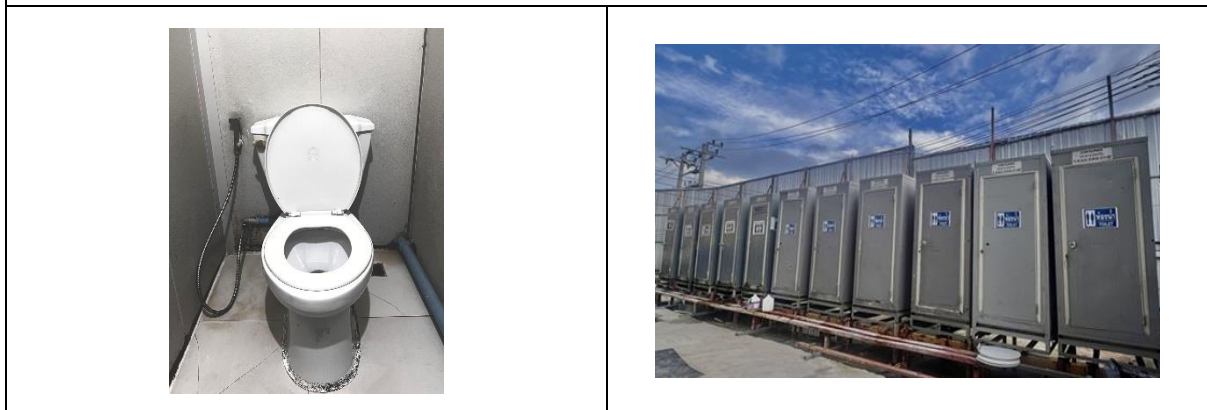
รูปที่ 34 ห้องน้ำ-ห้องส้วมสำหรับคนงาน