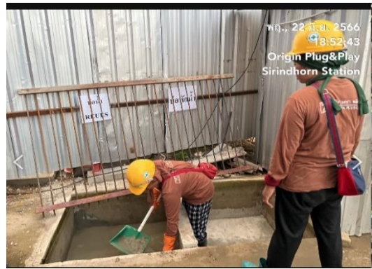
รูปที่ 12 บ่อดักตะกอนดิน