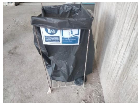
รูปที่ 37 ถังด้ารองรับมูลฝอย