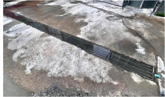
รูปที่ 11 รางระบายน้ำชั่วคราว