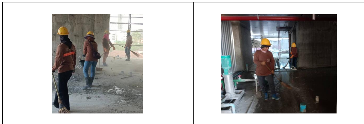
รูปที่ 18 การดูแลรักษาความสะอาดบริเวณด้านในโครงการ (ต่อ)