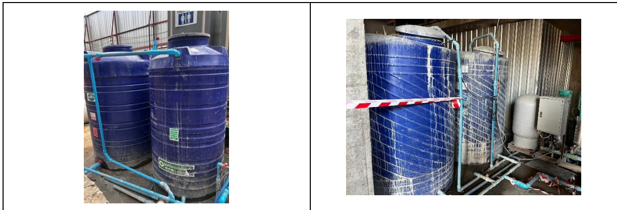
รูปที่ 32 ถังสำรองน้ำใช้ภายในโครงการ