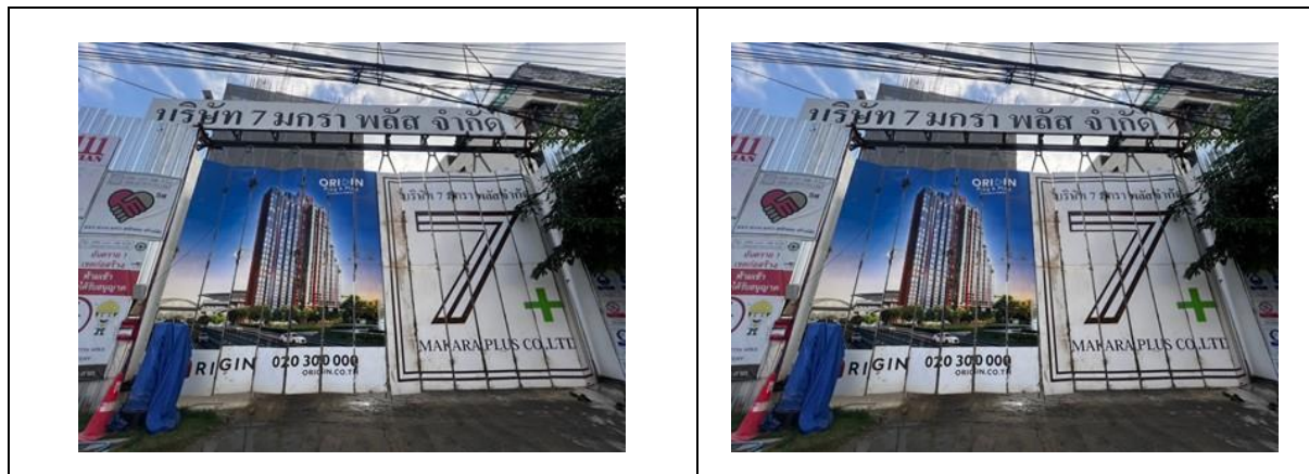
รูปที่ 16 ประตูด้านหน้าโครงการปิดทึบตลอดเวลา

รายงานผลการปฏิบัติตามมาตรการป้องกันและแก้ไขผลกระทบสิ่งแวดล้อมและมาตรการติดตามตรวจสอบคุณภาพสิ่งแวดล้อม โครงการ ออริจิน ปลีก แอนด์ เฟลย์ สตรีท สเตชั่น (ระยะก่อสร้าง) ของบริษัท ออริจิน ปลีก แอนด์ เฟลย์ จักรวรรดิ จำกัด