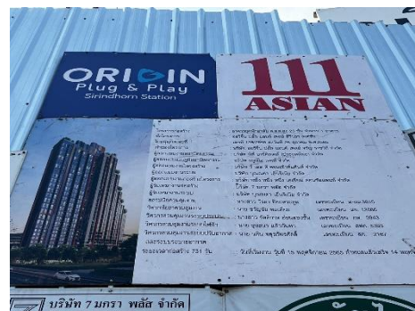
รูปที่ 28 ป้ายชื่อโครงการ