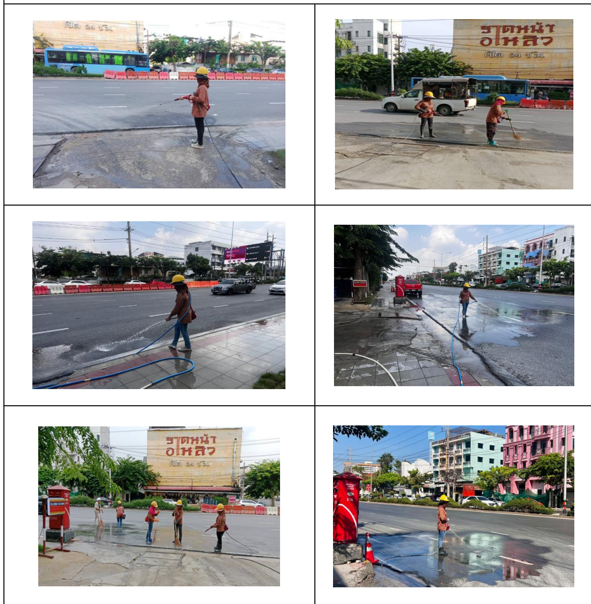
รูปที่ 17 การดูแลรักษาความสะอาดบริเวณด้านหน้าโครงการ