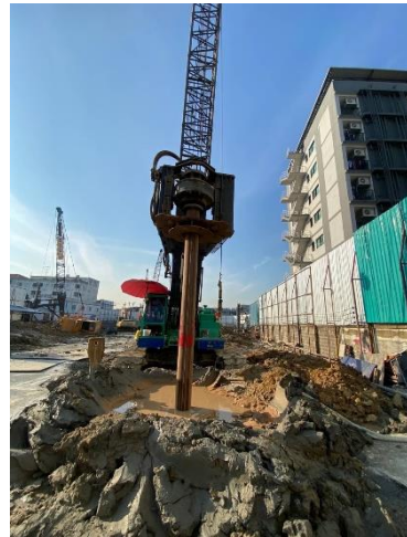
รูปที่ 23 การเลือกใช้วิธีการเจาะเสาเข็มแบบเปียก ในระยะเสาเข็มฐานราก