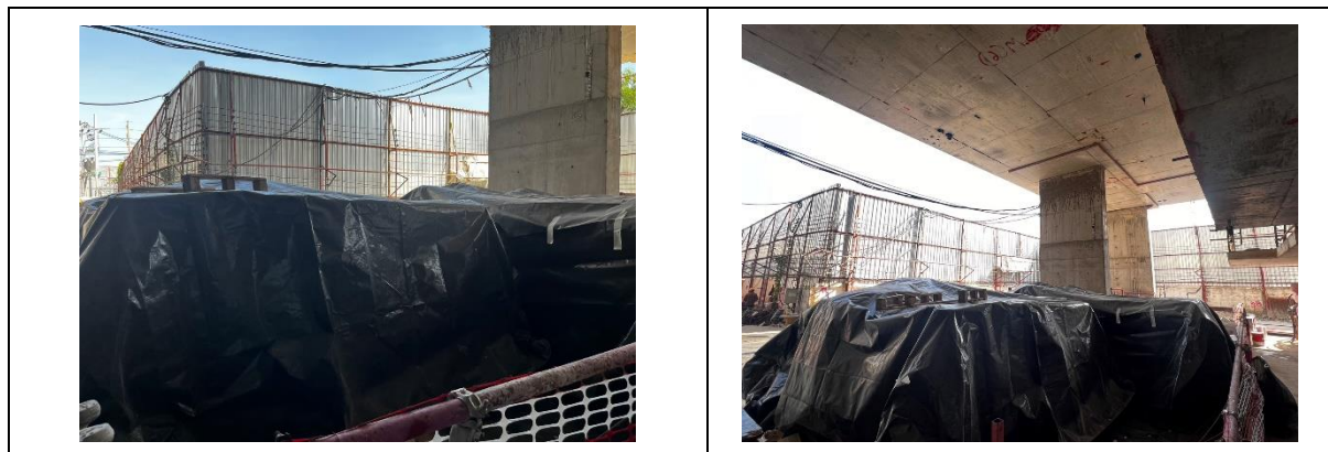
รูปที่ 14 การปิดคลุมกองเก็บวัสดุอุปกรณ์