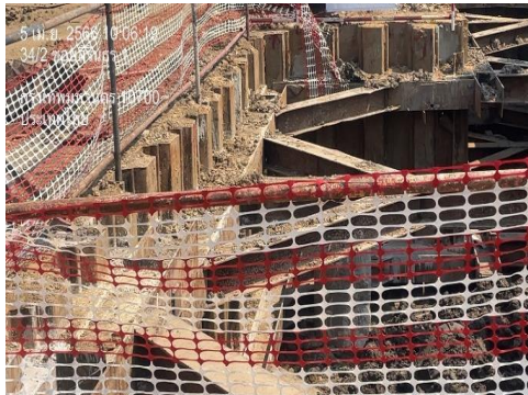
รูปที่ 25 การก่อสร้างแนว Sheet Pile ในระยะเสาเข็มฐานราก