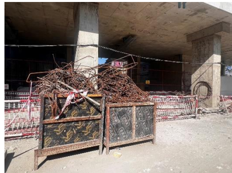
รูปที่ 7 การขนย้ายเศษวัสดุออกโดยไม่มีเก็บกองไว้ภายในพื้นที่โครงการ