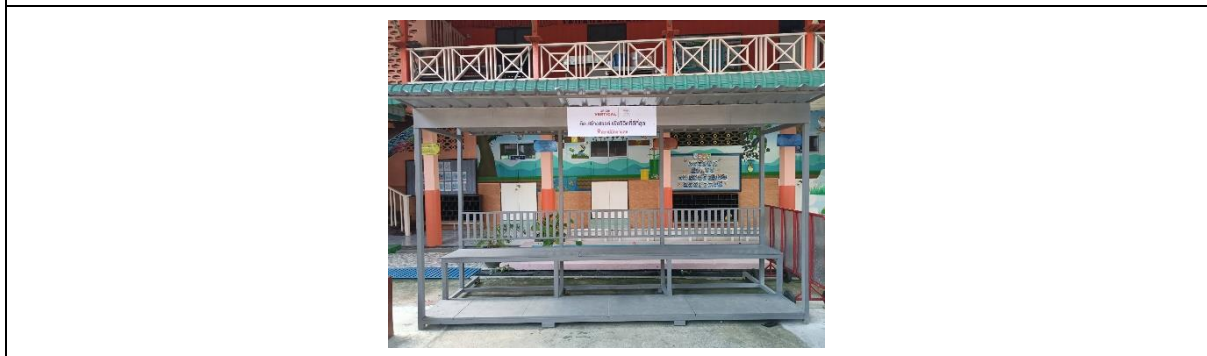
รูปที่ 51 กิจกรรมมวลชนสัมพันธ์กับชุมชนโดยรอบโครงการ