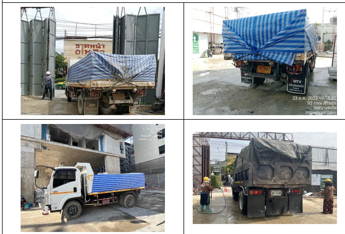
รูปที่ 15 การปิดคลุมท้ายรถบรรทุก