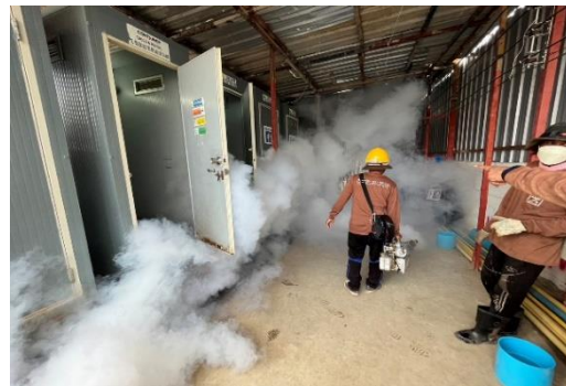
รูปที่ 36 การฉีดพ่นยากำจัดสัตว์พาหะนำโรค