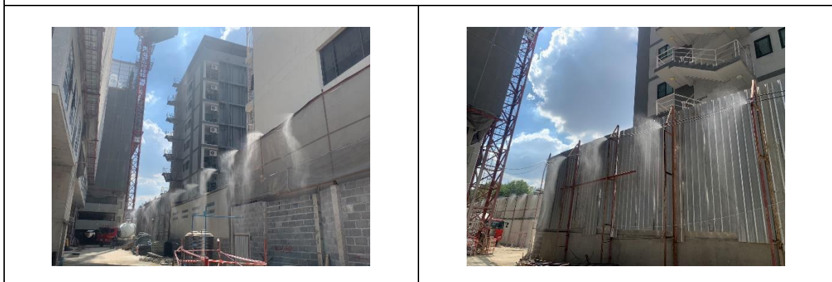
รูปที่ 52 การสเปรย์น้ำและฉีดพรมน้ำบริเวณพื้นที่โครงการ