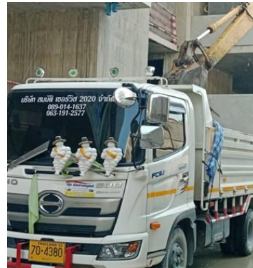
รูปที่ 26 ป้ายผัดด่านข้างรถ