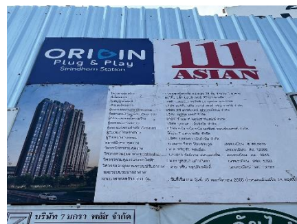
รูปที่ 3 ป้ายประชาสัมพันธ์บริเวณด้านโครงการ