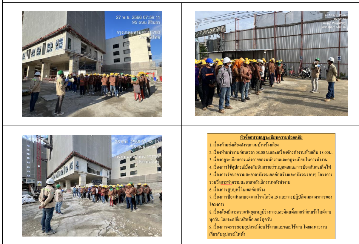
รูปที่ 39 กิจกรรม Safety Talk