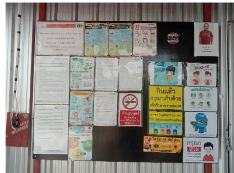
รูปที่ 40 บ้านพักคนงาน