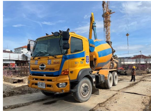
รูปที่ 13 รถบรรทุกปูนสำเร็จรูป