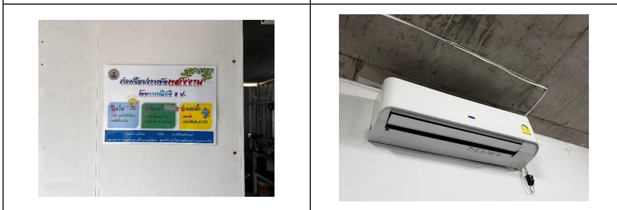
รูปที่ 42 การรณรงค์ช่วยกันประหยัดไฟ