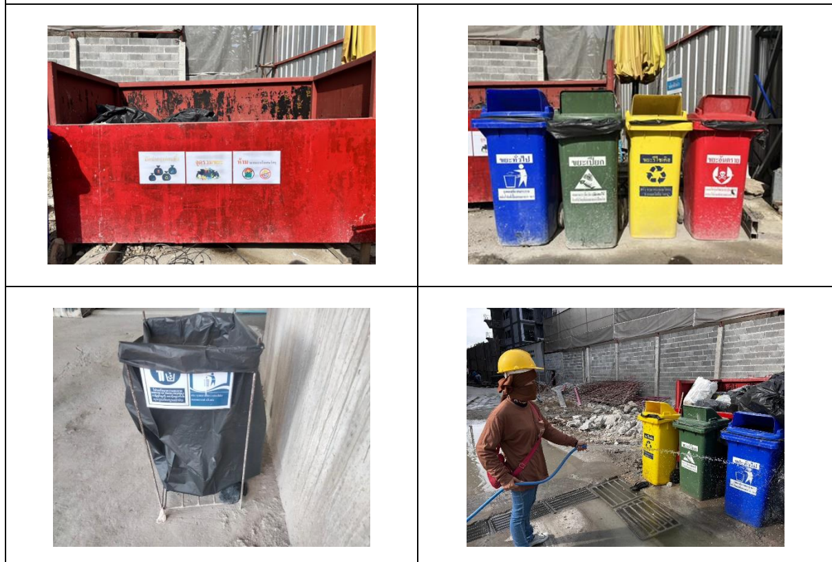
รูปที่ 31 ถังขยะแบบมีฝาปิด